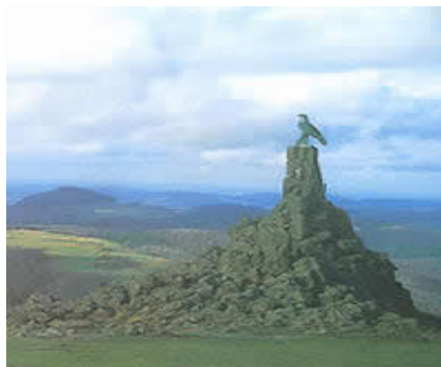
Fliegerdenkmal auf der Wasserkuppe

mit zwei Betten, Waschbecken mit warmem und kaltem Wasser und einem separaten WC. Bodenbelag: Teppich